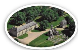
Domaine de Chaalis