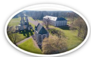
La chapelle, le château et les ruines de l'Abbaye de Chaalis

L'abbaye de Chaalis est fondée par Louis VI Le Gros au XII ème siècle. Des moines cisterciens s'y installent pendant plusieurs siècles. Le Comte de Clermont, abbé de Chaalis, transforme l'édifice au XVIII ème siècle avec entre autres la construction d'un bâtiment abbatial composé de diverses pièces comme la cuisine des moines, la salle de billard et, à l'étage, des cellules monacales. Cette construction n'est autre que l'actuel château-musée.