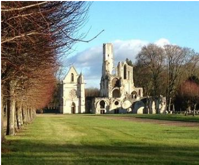
La chapelle et les ruines de l'abbaye