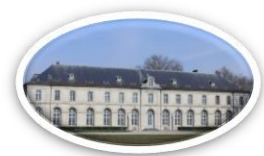
Château-musée Jacquemart-André, domaine de Chaalis