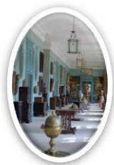
Galerie des portraits, musée Jacquemart- André, domaine de Chaalis

Le domaine de Chaalis est un lieu singulier, où ruines d'une abbaye cistercienne et château-musée du XIX ème siècle renfermant des collections uniques venues du monde entier cohabitent dans un lieu bordé de verdure. Une chapelle ornée de fresques du Primitice, une orangerie, des écuries, deux pavillons d'entrée, un moulin, un mur construit par Serlio au XV ème siècle se dressent entre ces deux édifices dans un environnement apaisant et verdoyant mis en lumière par la roseraie, le jardin des aromatiques ou encore le parc à la française. Cette richesse culturelle et architecturale permet de proposer à vos élèves des activités très variées, pour chaque niveau de classe.